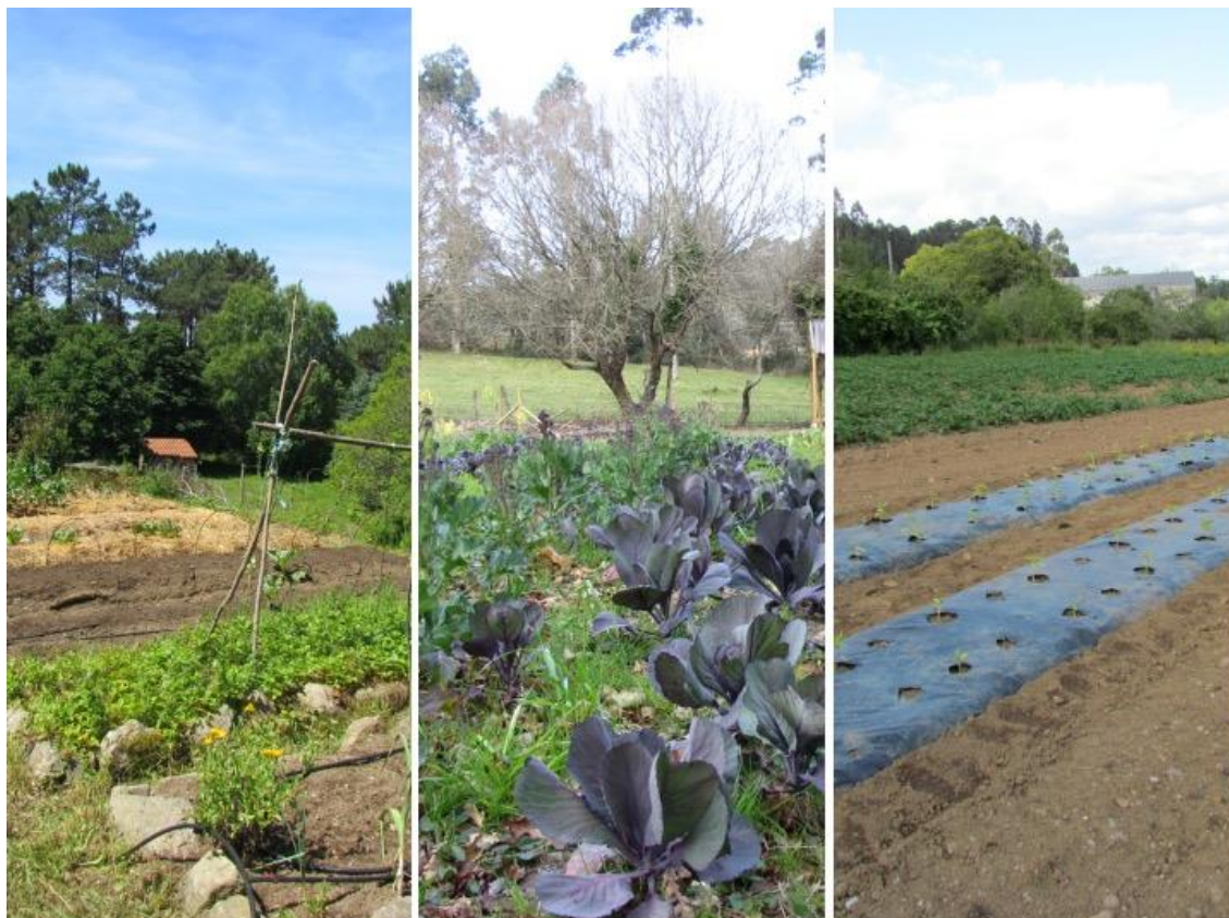
Exemplos de fincas de produtoras/es que proven iniciativas analizadas, situadas respectivamente en contextos rurais costeiras e do interior, ou en zonas rurais periurbanas de áreas metropolitanas. Esquerda: Xestas (Porto do Son). Centro: Roupar (Xermade). Dereita: Santa Marta de Babío (Bergondo).

Cómpre salientar a evolución experimentada nas iniciativas presentes nalgunhas zonas concretas, que deron lugar a modelos distintos, reproducíronse en novos colectivos ou foron mudando de modelo para adaptarse ás circunstancias das persoas que as integran.