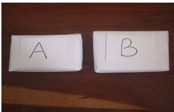
Figura 01: Caixas brancas, fechadas e com objeto em seu interior.

sem abri-las, escrevendo e justificando as características dos objetos, como forma geométrica, som, tamanho, se era leve ou pesado, etc. Também foi solicitado aos licenciandos que fizessem o desenho de uma representação do objeto, utilizando as características que haviam anotado. Cada grupo repetiu o procedimento para as duas caixas, sendo solicitado, após primeira análise, que fizessem um pequeno furo na caixa, que permitia que os estudantes cutucassem com um palito de churrasco o(s) objeto(s) no interior da caixa, em analogia ao papel que as tecnologias têm na Ciência. Ao final da atividade houve a socialização dos resultados com toda a turma, com questionamentos, discussões e reflexões.