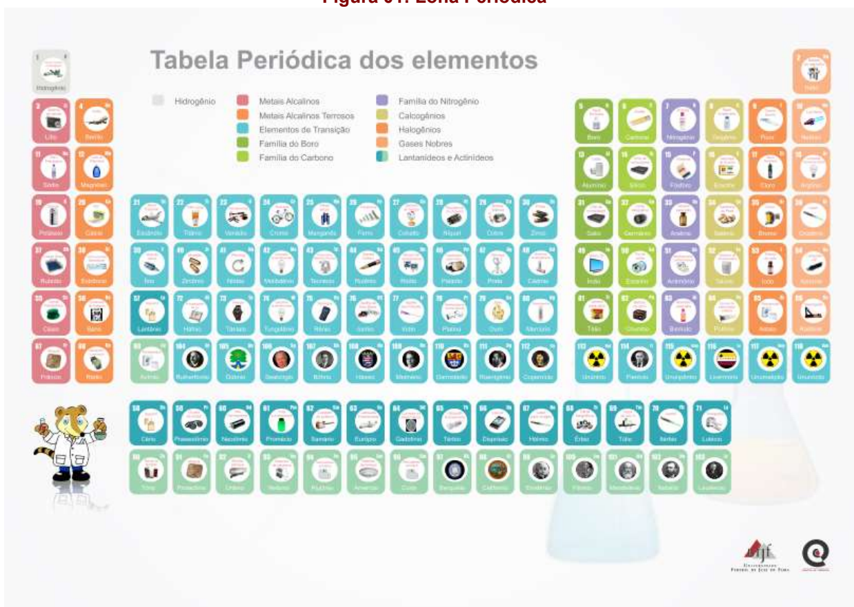
Figura 01: Lona Periódica