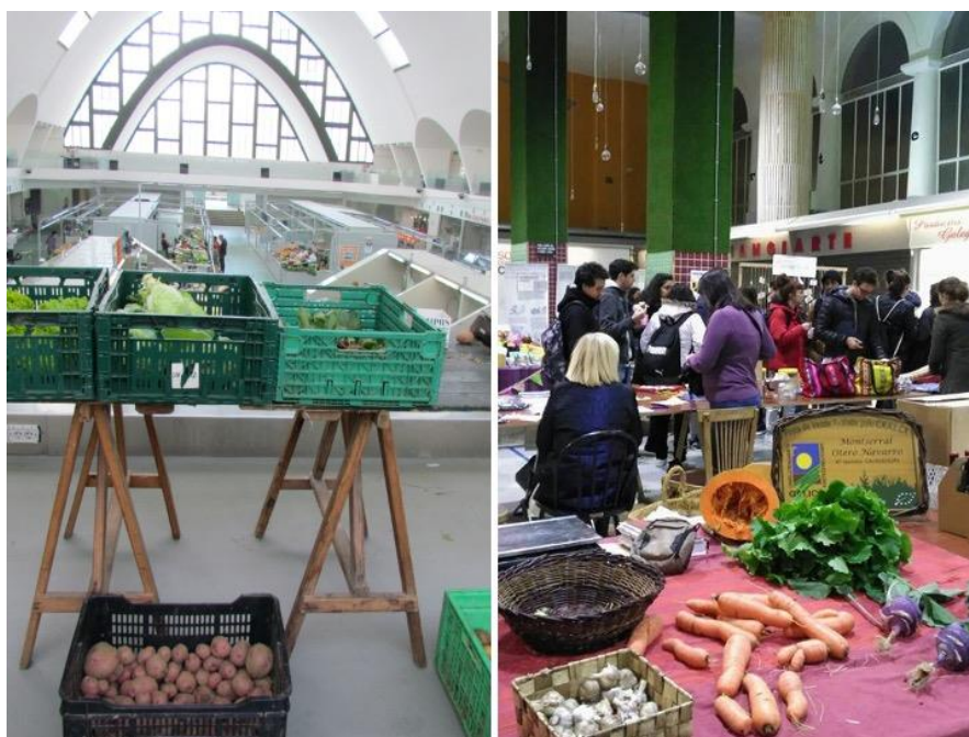
Figura 7. Mercados autoxestionados no interior de mercados de abastos.

Esquerda: Mercado autoxestionado de produtoras/es locais organizado por Labrega Natura no interior do mercado de San Agustín (A Coruña); fotografía: K.M. Bisquert (2019). Dereita: Mercado da Terra, celebrado no interior do mercado municipal Quiroga Ballesteros (Lugo); fotografía: https://mercadodaterra.noblogs.org .