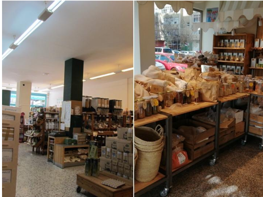
Esquerda: local da Cooperativa de Consumo Árbore (Vigo). Dereita: local da CTA Mercado da Terra (Ferrol).

Por último, agréganse sete colectivos conformados por produtoras/es locais - e consumidoras/es nalgúns casos -, que organizan e celebran de maneira autoxestionada e periódica feiras, mercados e encontros de consumo responsable (Figura 3), ben sexa en prazas, parques e outros espazos ao aire libre, ben no interior de instalacións públicas municipais (Figura 7).