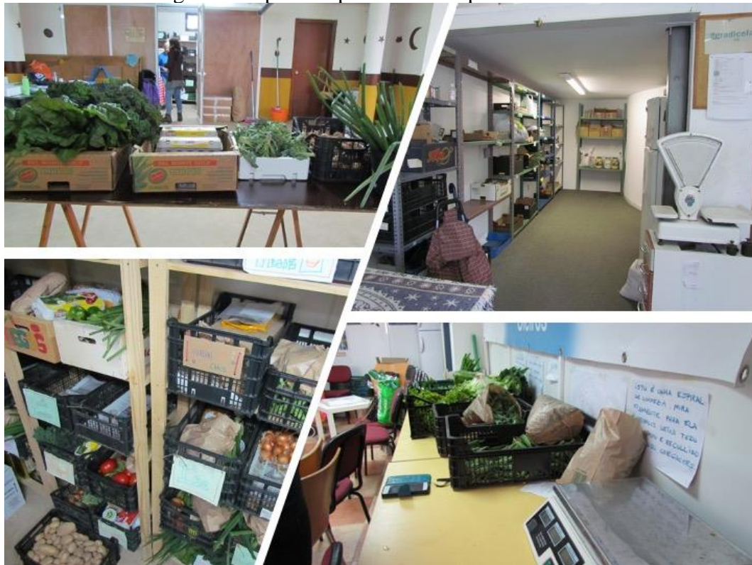
Figura 1. Espazos e procesos de reparto dos GdC.

Esquerda: reparto no GdC Eco_Lóxico (Ponte Caldelas). Arriba-dereita: local do GdC A Gradicela (Pontevedra). Abaixo-dereita: reparto no GdC Millo Miúdo (Oleiros).