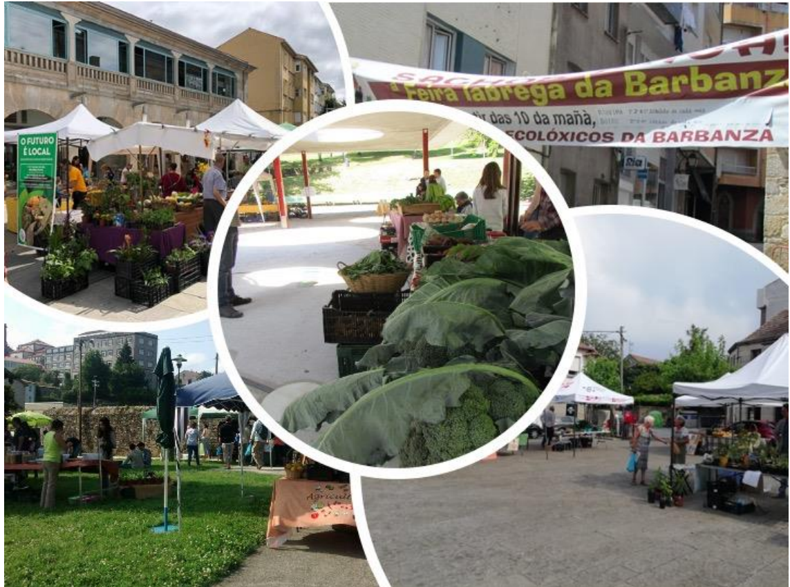
Figura 3. Feiras, mercados e encontros de consumo responsable.

Arriba-esquerda: mercado 4Ponlas (Pontevedra); fotografía: https://www.facebook.com/4ponlas/ (2018). Arriba-dereita: faixa na feira labrega organizada polos Foros Ecolóxicos da Barbanza (Ribeira); fotografía: KM. Bisquert (2019). Abaixo-esquerda: mercado agroecolóxico Entre Lusco e Fusco (Santiago de Compostela); fotografía: https://www.facebook.com/mercadoentreluscoefusco (2018). Abaixo-dereita: encontro agroalimentario de produtoras e consumidoras organizado pola Asociación O Toxo (Gondomar); fotografía: https://www.facebook.com/asoc.otoxo (2019). Centro: Mercado de Alimento Labrego (Teo); fotografía: K.M. Bisquert (2019).