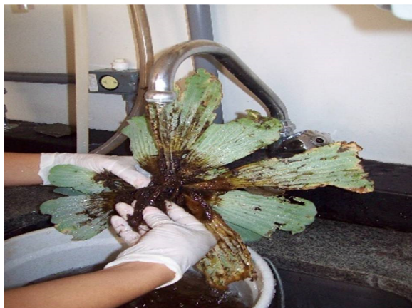
Figura 2. Lavagem de Pistia stratiotes para obtenção da fauna associada.

Em laboratório, as amostras de P. stratiotes foram levemente lavadas com água corrente, utilizando peneira com malha de 0,20 mm de abertura, visando desprender os organismos associados, os quais foram fixados e preservados em álcool 70% para análises posteriores (Figura 2).