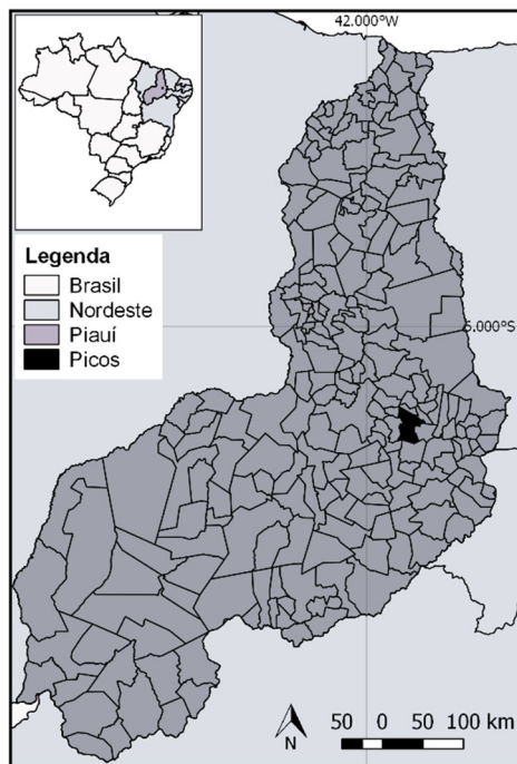
Figura 1. Localização do município Picos no estado do Piauí, Brasil.

Ambiente local, a qual tem a responsabilidade pelo manejo da arborização destes espaços.