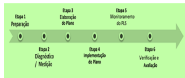
Figura 4. Etapas de Implantação do PLS.

Seguindo essa ideia, no âmbito da Instrução Normativa nº 10/2012, a Secretaria de Logística e Tecnologia da Informação do Ministério do Planejamento divulgou um roteiro para elaborar o PLS em suas etapas: preparação, diagnóstico, elaboração, implementação, monitoramento e avaliação. Todas essas etapas, representadas na Figura 4 abaixo, levam a um maior diálogo, a fim de orientar e acompanhar a realidade das instruções acerca de seus planos.