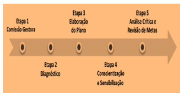
Figura 3. Etapas de Implantação da A3P.

Depois de assinar o termo de adesão, o órgão deverá prosseguir com as etapas descritas abaixo, visando ratificar a implementação da agenda. O MMA sugere um método baseado em cinco etapas, para uma boa implantação da A3P: a) criar uma Comissão Gestora; b) fazer o diagnóstico socioambiental; c) realizar o Plano de Gestão Socioambiental; d) elaborar campanhas de sensibilização e conscientização; e) avaliar e monitorar o Plano de Gestão Socioambiental (Vasconcellos, 2015). A Figura 3 apresenta cada uma das cinco fases.