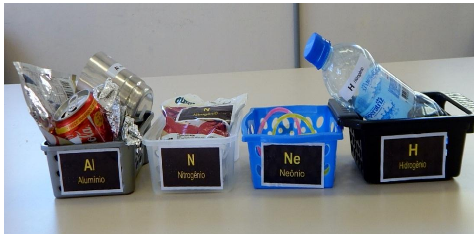
Figura 03: Caixas de referência com amostras representativas de átomos presentes em alguns elementos químicos.