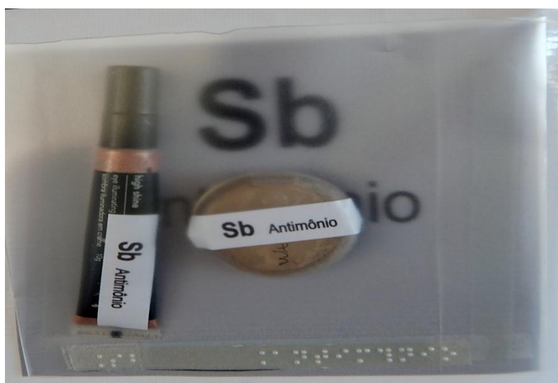
Figura 02: Amostras de materiais que contêm substâncias que possuem átomos dos elementos químicos em sua composição, organizados em bolsos plásticos, com transcrição em BRAILLE.