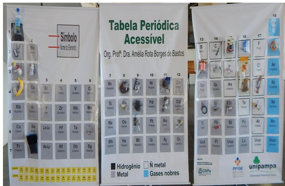
Figura 01: Tabela Periódica Acessível.

As amostras representativas dos objetos que contêm átomos dos elementos químicos foram organizadas em caixas de referência (figura 3). Essas caixas foram organizadas da mesma forma que a tabela, com pistas visuais e táteis.