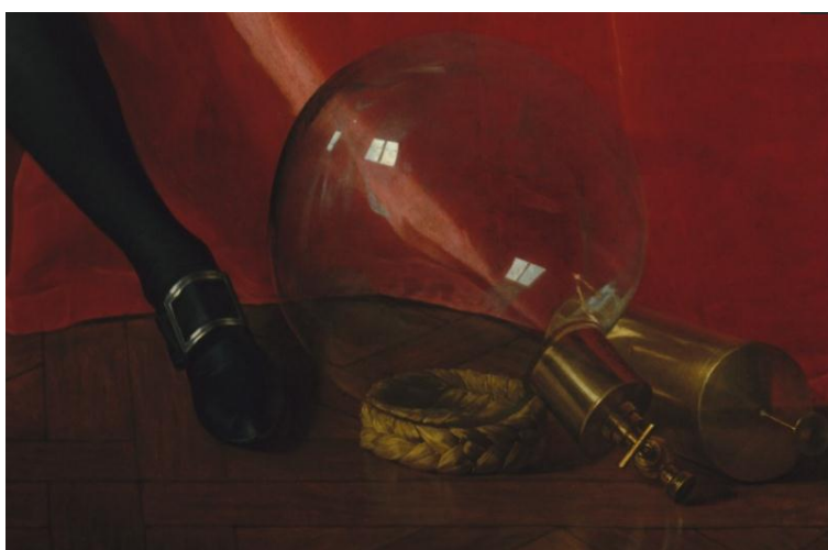
Figura 04: Detalhes do quadro mostrando equipamentos utilizados por Lavoisier.