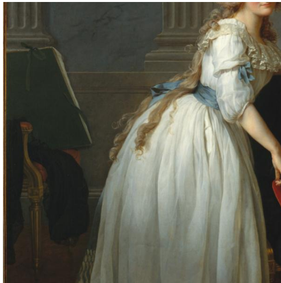
Figura 03: Detalhes do quadro mostrando o provável portfólio com desenhos de Marie-Anne Lavoisier.