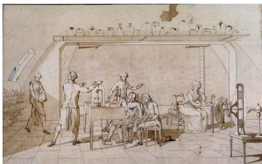
Figura 07. Desenho de Marie-Anne Lavoisier para o experimento de consumo de oxigênio com o sujeito realizando trabalho.

Em uma segunda ilustração, pode-se verificar a execução de um experimento semelhante, mas dessa vez o homem com a máscara está realizando um pequeno movimento, como é possível observar por causa do pedal em seu pé por baixo da mesa. Novamente, Marie-Anne Lavoisier se auto-retrata observando o experimento e tomando notas à direita da ilustração (Figura 07).