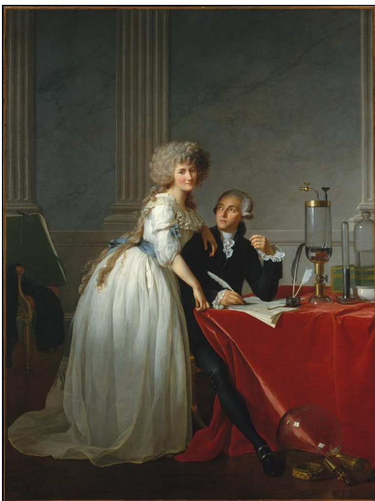
Figura 01: Antoine Laurent Lavoisier and His Wife , de Jacques-Louis David, 1788.

Fonte: Public Domain, Metropolitan Museum of Art [US]. Disponível em: https://goo.gl/Dnpz6s