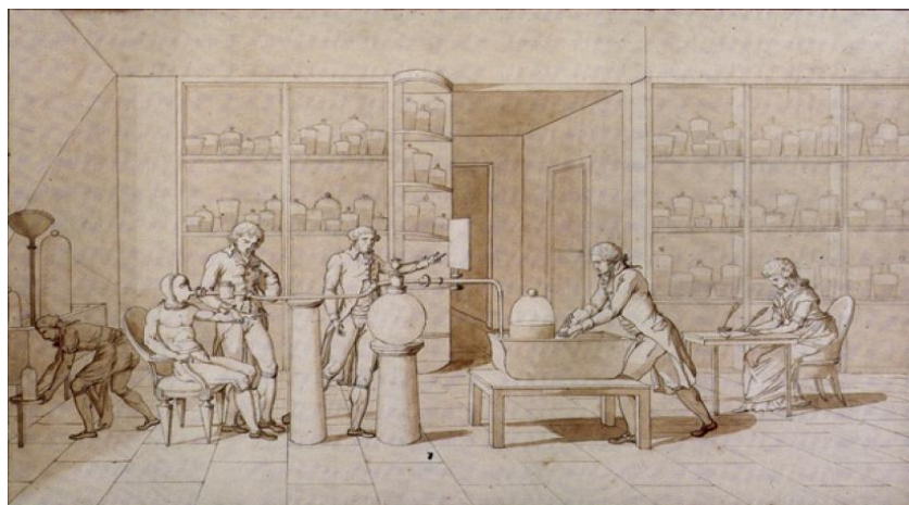
Figura 06. Desenho de Marie-Anne Lavoisier para um experimento sobre consumo de oxigênio.