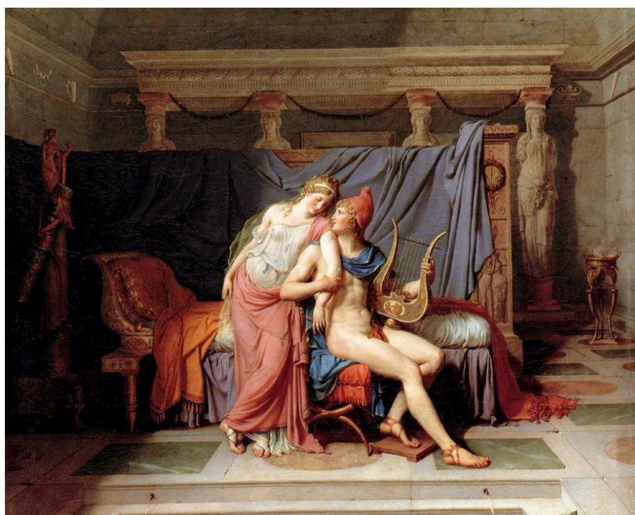
Figura 02: Paris e Helena, de Jacques-Louis David, 1788.

Finalizados no mesmo período, o quadro Paris e Helena retrata o casal, personagens da Ilíada de Homero, responsáveis pelas tramas de amor, traição, rapto e guerra em Tróia.