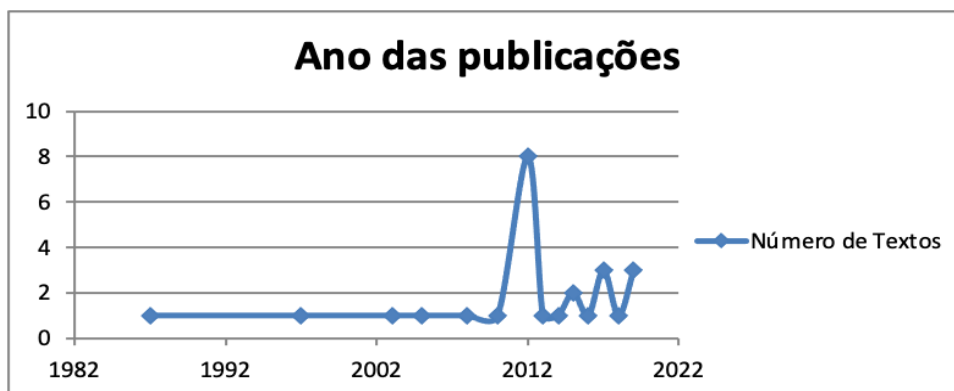
Gráfico 1: Identificação da distribuição anual das publicações do corpus .

Desta forma, ainda que significativamente em menor quantidade do que em relação a textos publicados em língua inglesa, é possível sugerir que futuramente pode existir um número maior de artigos publicados em português, uma vez que os estudos sobre história e epistemologia vêm se desenvolvendo em nosso país, principalmente por meio da criação de programas de pós-graduação voltados à temática da História e da Filosofia da Ciência. Esse possível crescimento de publicação em língua portuguesa também se associa à tendência do quantitativo de trabalhos evidenciada. De acordo com a análise, os trabalhos publicados na articulação entre as discussões bachelardianas, a história, epistemologia e o Ensino de Química, é possível evidenciar um esforço e sugerir uma tendência de crescimento (Gráfico 1). Aproximadamente a partir do ano de 2015 as publicações vêm apresentando uma oscilação que pode colaborar para seu aumento com o passar dos anos.