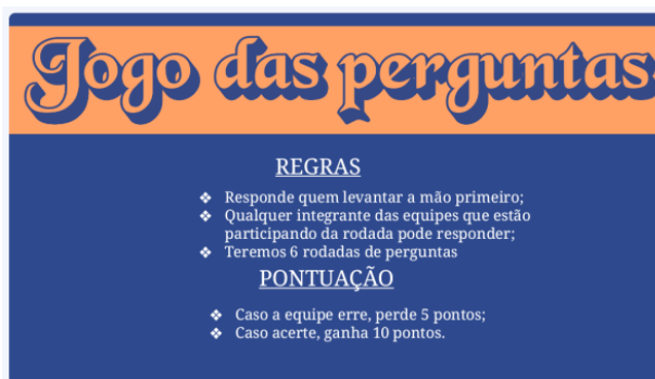
Figura 4: Atividade da gincana "Jogo das perguntas"