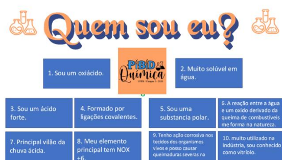
Figura 2: Atividade da gincana "Quem sou eu?"

Na primeira atividade intitulada "Quem sou eu?", um dos grupos deveria descobrir qual a substância química em questão. O jogo foi constituído de rodadas e cada rodada composta por uma dica. O grupo que suspeitasse qual substância se tratava deveria levantar a mão, podendo utilizar o microfone ou o chat para responder e não seria aceita mais de uma palavra, sendo considerada apenas a primeira. Pontuava aquele grupo que respondesse primeiro a palavra correta. Foram elaboradas dez dicas, como podemos observar na Figura 2.