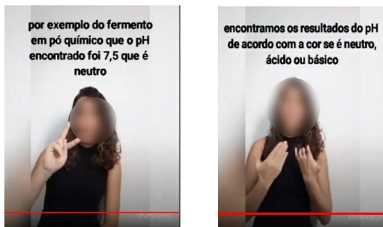
Figura 6: Vídeo sobre o experimento de ácido-base