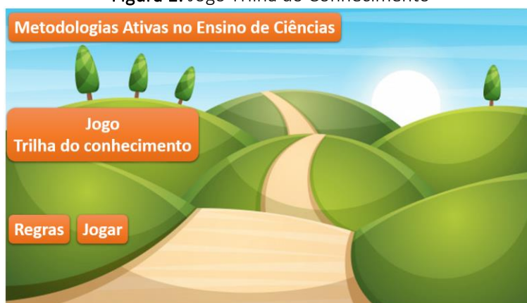
Figura 1: Jogo Trilha do Conhecimento

A primeira metodologia ativa a ser discutida foi o Ensino por Investigação e para desenvolver esse assunto utilizamos a Gamificação como metodologia ativa de ensino do encontro. A figura 1 representa a capa do game elaborado por PQ1.