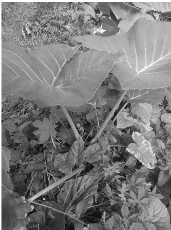
Figura 1. Amostras de taioba ( Xanthosoma taioba ) nos entornos da vegetação da UFRPE.

A planta pode chegar a alcançar dois metros de altura e apresentar folhas com 80 centímetros de comprimento e 60 centímetros de largura. Em locais onde se planta o cacau, a taioba, após 10 meses de cultivo, pode ter um papel significativo na recuperação do solo esgotado pela cultura do cacau. A maior importância da taioba está no seu valor alimentício. As folhas são boas para o preparo de saladas, e são de fácil preparo. Os tubérculos que ela produz têm características semelhantes aos tubérculos do inhame (ABRAMO, 1990 apud GEPTS et al., 2008).