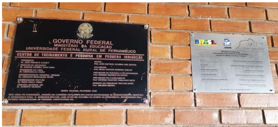
Figura 3. Placas comemorativas alusivas às inaugurações do CTPPI (esquerda) e da UAST (direita), fotografadas juntas em agosto de 2006.

Hoje a Unidade Acadêmica de Serra Talhada (UAST) congrega um grande número de jovens universitários, oriundos de diferentes regiões, para estudarem e, com seus mestres,