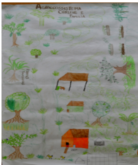
Figura 2- Mapa da Agricultora Chirlene- Agreste/PE