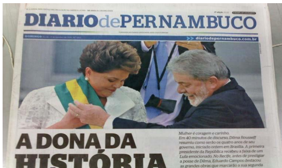
Figura 4: Manchete da posse da presidente Dilma Rousseff.

Dilma Rousseff foi a primeira mulher a assumir a presidência do país. Se pesquisássemos, junto à população, os nomes dos presidentes da República mais recordados, sem dúvida, os quatro nomes que figuram neste artigo estariam entre os mais citados. No contexto histórico do século XXI, o Brasil desenvolveu-se social e economicamente e possui o sistema de votação mais avançado do mundo. Os jornais, por sua vez, gozam e apresentam autonomia e liberdade de expressão, mantendo a função de portadores e formadores de opinião. No exemplo seguinte, temos a manchete da primeira página que divulgou a posse histórica da atual presidente.