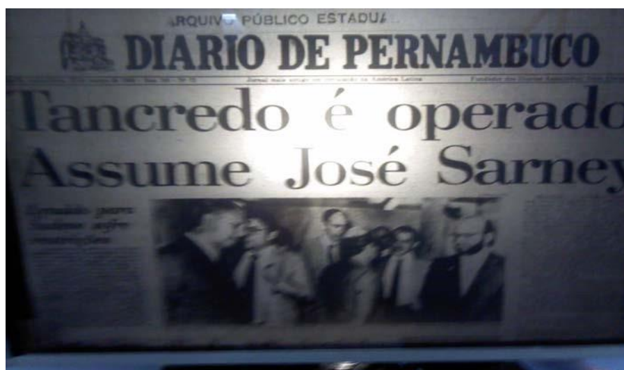
Figura 3: manchete sobre transição de Tancredo para Sarney

Nesse ano, o Brasil passava por um momento de transição histórica. A vitória de Tancredo Neves, em 15 de janeiro de 1985, marcava o fim de mais de 20 anos de regime militar no país. O então ex-governador de Minas Gerais representava um arauto de esperança para uma população que sobrevivera a décadas de repressão. Porém, a tão esperada posse nunca ocorreu. No dia 14 de março, véspera de assumir o cargo, Tancredo teve de ser operado às pressas em Brasília. Esse era o início de um pesadelo que exigiria outras intervenções cirúrgicas e se estenderia até sua morte, em 21 de abril do mesmo ano. Os jornais registraram a incerteza e a agonia vivenciadas pela sociedade. A figura a seguir mostra a capa do Diario , que deveria anunciar a posse presidencial, mas que se converteu num conjunto de textos que abordavam temáticas relacionadas à manchete abaixo: