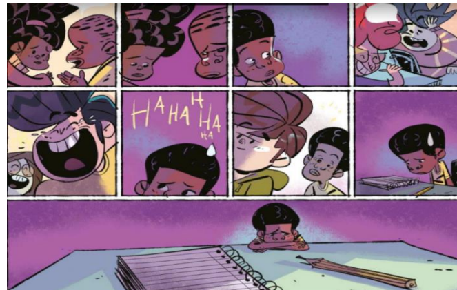
Figura7 – Jeremias sente-se inferiorizado após sofrer preconceito.

Este é o primeiro momento em toda a história em que o personagem demonstra uma expressão de tristeza, mal-estar, o que podemos perceber, segundo Cagnin (2013), através do uso da boca fechada e curva para baixo e do arranjo dos olhos semiabertos e sobrancelhas curvas. A cor usada de fundo do quadro também muda, de amarelo é adotado um tom de violeta para ressaltar a sensação de desconforto do personagem. Esse tom passa a ser adotado em vários quadros durante a narrativa para demonstrar os momentos de conflito e apatia do personagem. De acordo com Heller (2014) a cor lilás ou violeta pode fazer ligação com a violência e sentimento de violação, fortalecendo a sensação de agressão sofrida por Jeremias ao ser discriminado.