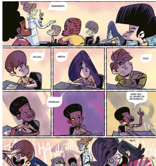
Figura 6 – a turma de Jeremias zomba de seu sonho de ser astronauta.