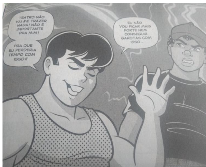
Figura 2 - Titi, na HQ Turma da Mônica Jovem N°30, desdenhando da turma que está participando do teatro.

Essa edição traz uma problemática bem interessante sobre machismo e preconceito, quando coloca Jeremias se envolvendo com o teatro e discutindo com seu amigo Titi por conta de sua postura preconceituosa com relação ao ofício de ator.