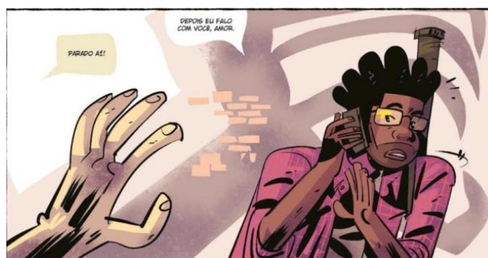
Figura 8 – O pai de Jeremias é abordado pela polícia.

Jeremias começa a perceber a visão estereotipada com a qual os negros são tratados, na escola, na sua revista em quadrinhos preferida, e isso começa a incomodá-lo até o ponto de brigar na escola. Neste momento, seu pai é chamado e mais uma vez vemos uma instituição sendo questionada pela sua conduta racista.