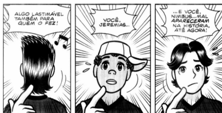
Figura 3 - Narrador brinca com a falta de relevância de Jeremias para a história da HQ Turma da Mônica Jovem N° 11.

Mesmo tendo boas aparições na Turma da Mônica Jovem e com histórias relevantes, Jeremias ainda assim não chegou a ser protagonista de fato ou ter regularidade em suas aparições. No trabalho de Elbert Agostinho, ele cita a história “ Ser ou Não Ser ”, de 2009, na qual o narrador chega a brincar com a pouca relevância do personagem na história.