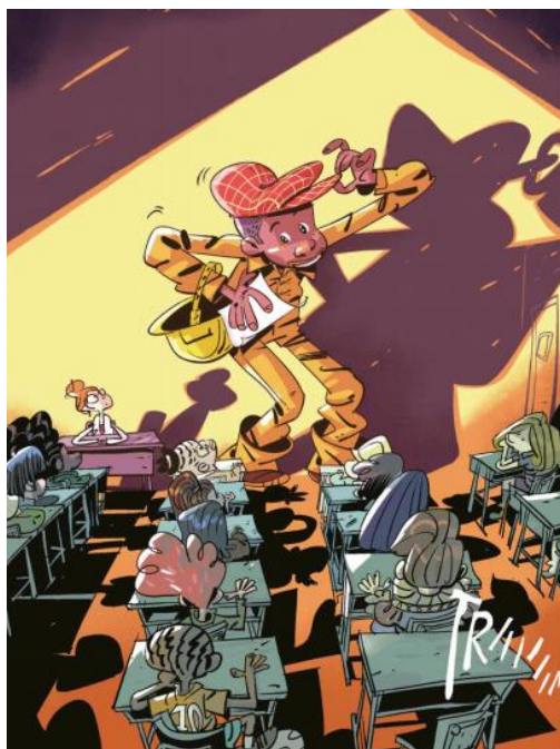
Figura 10 – Jeremias realiza com orgulho a apresentação da profissão de pedreiro.

No discurso final de Jeremias, os autores usam o contra-plongé mais uma vez para conotar a força e a confiança retornando ao protagonista. A imagem entra em contraste com a representação do personagem na figura 7, aqui o arranjo dos olhos bem abertos e sobrancelhas e bocas arqueadas para cima representam a alegria e felicidade, segundo Cagnin (2013). Além de voltarem a usar a cor amarela de fundo do quadro, que aqui volta a representar o otimismo e a jovialidade em contraste com a tristeza/ violência/ tensão do violeta.