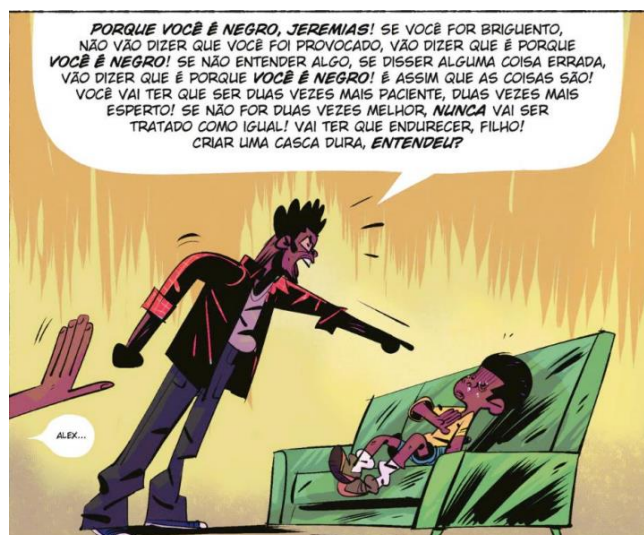
Figura 91 – O pai de Jeremias briga com o filho após ele ter brigado na escola.

A fala do pai de Jeremias deixa claro que a questão do racismo vai além das instituições, mas faz parte da questão social. “As instituições são racistas, porque a sociedade é racista.” (ALMEIDA, 2019, p.47). O discurso trazido na fala do pai evidencia a Jeremias que ele nunca será tratado como um igual, não importa onde for ou o que faça: para a estrutura social vigente o racismo é um padrão.