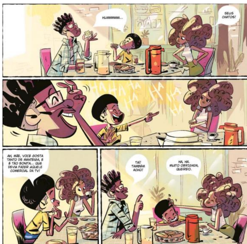
Figura 5 – Família em café da manhã feliz.

cultura do colonizador com o intuito de criticar e subverter aquela ação. Reverberam, então, estas palavras: “A quase-identidade do sujeito colonial com o sujeito dominante, descrito por Bhabha como “quase o mesmo, mas não é branco”. (BHABHA apud BONNICI, 2005, p.196).