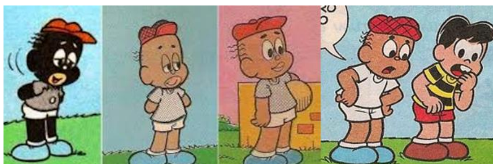
Figura 1- Evolução do personagem Jeremias ao longo dos anos.

Nesta época, os quadrinhos ainda eram produzidos com apenas duas palhetas de cor, preta e branca, e o personagem Jeremias era pintado em nanquim e ainda não tinha sua boina característica. A partir de 1961, Jeremias passou a ser desenhado dentro de um estereótipo conhecido como blackface .