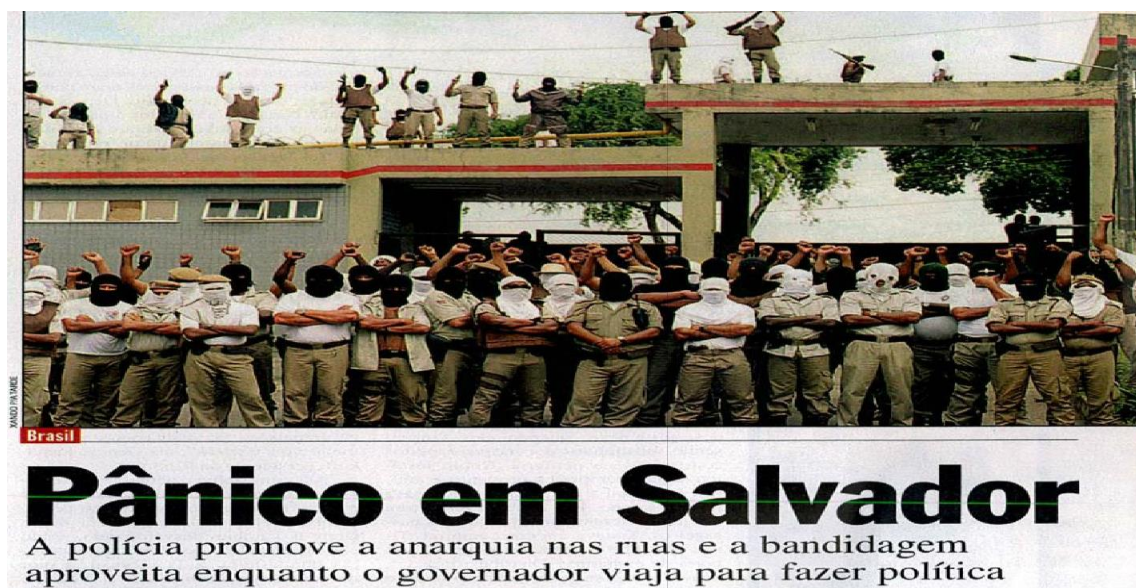
Figura 2 – PMs aquartelados: Greve de 2001