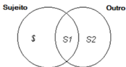
Fig. 1 (A Alienação. In: LACAN, J. 2008, p.219)

Lacan, define a alienação como o resultado (S1) da interação de dois conjuntos – o do sujeito, representado pelo símbolo ‘$’, e o do Outro , composto pelo símbolo ‘S2’. Para o autor, o sujeito se constituiria aí, quando toma um significante do Outro , e o utiliza para se representar junto a outros significantes de S2, nomeando o vazio ou o que chama de “materialização” da ausência 3 - o espaço representado por S1.