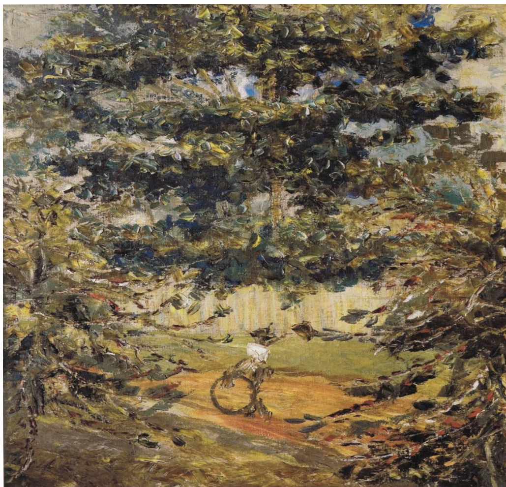
Figura 2: BAKUN, Miguel. Paisagem [colheita de café] 1962 óleo sobre tela 60 X 45 cm col. Particular. Prêmio Arno Iwersen, em pintura no Salão do Paraná. Fonte: PROLIK, Eliane (org.). Miguel Bakun a natureza do destino . Curitiba: Edição do autor, 2009. p. 81.

Observa-se na tela acima a paisagem que remete a um cafezal. Na tela, bem definida quanto aos objetos constituintes no seu espaço pictórico, nota-se, em primeiro plano, um pé de café no lado inferior direito e outro no lado inferior esquerdo, performatizando o final (ou o começo) de duas fileiras plantadas de café. Notamos o espaço vazio entre as duas fileiras, e, no final de ambas o desenho de uma peneira, objeto para peneirar o grão de café, separando-o de ciscos e folhas, o que denuncia, ali, a presença do humano em meio ao cafezal.