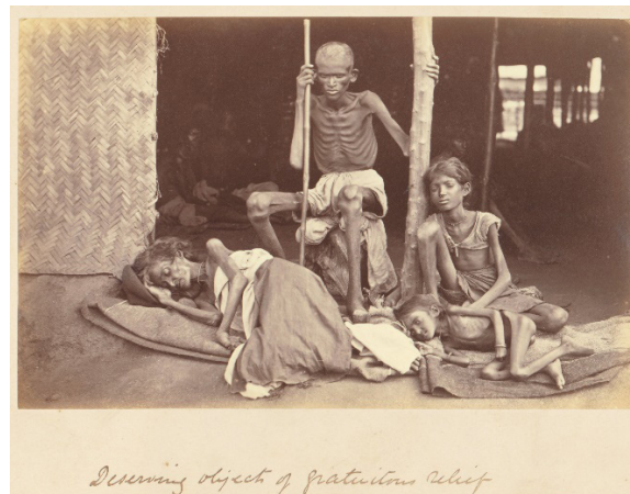
Figura 3 - Fome de Mandras, Índia