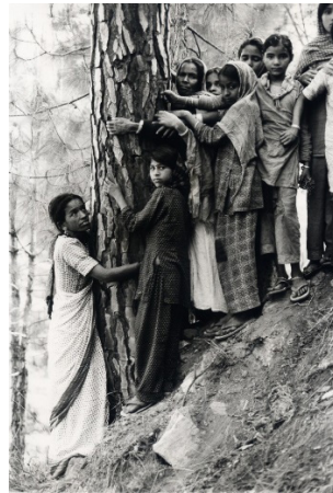
Figura 2 - Mulheres e meninas indianas abraçando uma árvore